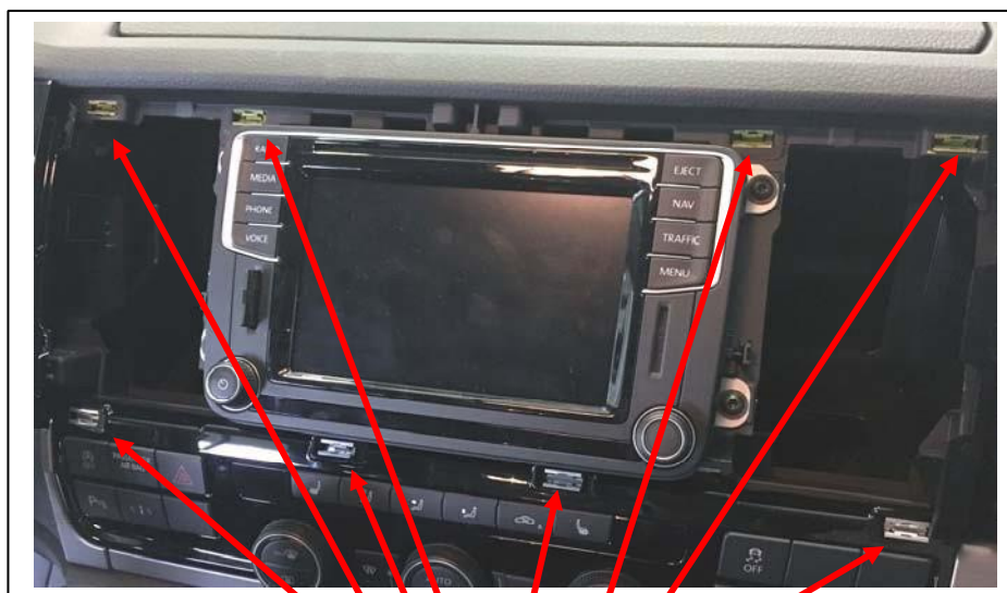
Halteklammern des Rahmens